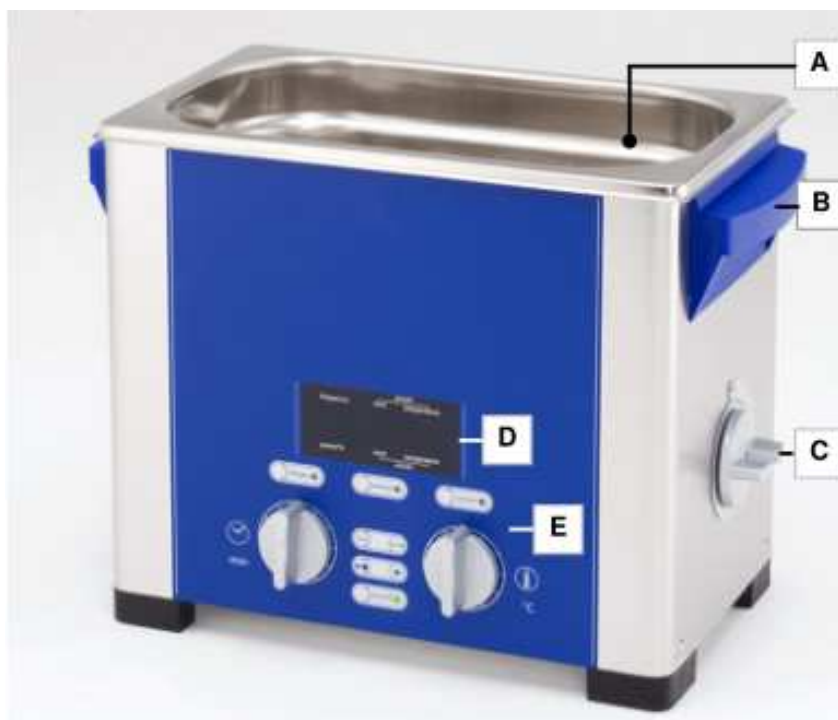
Slika 4.4 Sprednja stran/pogled s strani