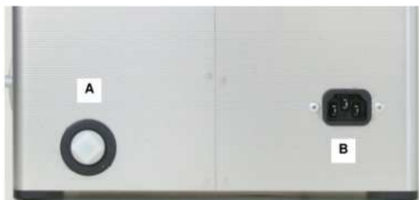
Slika 4.5 Zadnja stran