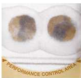
Positive Test Result