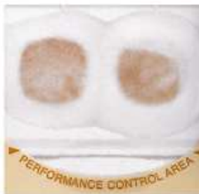
Negative Test Result