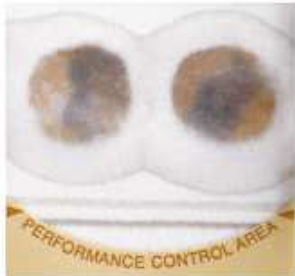
Positive Test Result