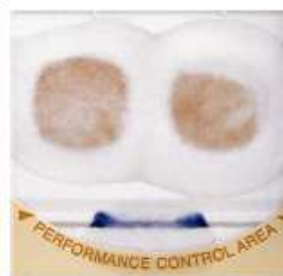
Performance Control Area