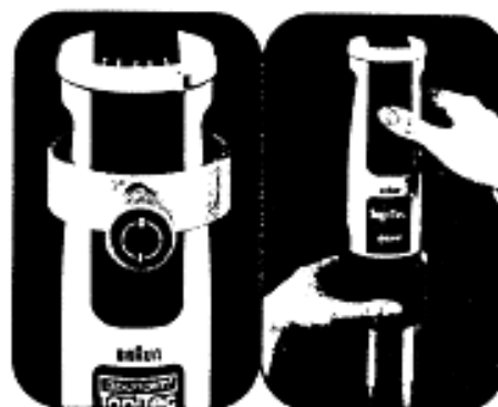
Motor: Braun Sistem; Wepa