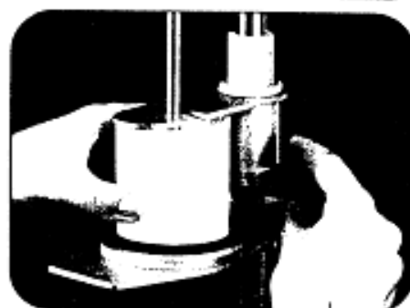
Enostavna namestitvev in uporaba apomom odmernih lončkov